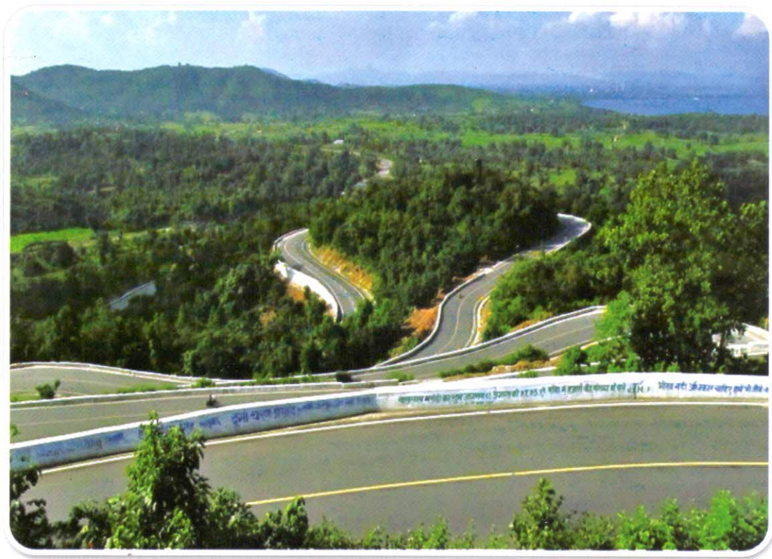
पतरातू (राँची) घाटी का विहंगम दृश्य